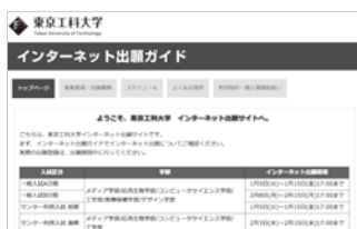
東京工科大学「インターネット出願サイト」このページから出願登録ができます。