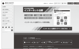
本学Webサイトトップページから「インターネット出願サイト」にアクセス

◎「マイページ」は、入学検定料支払い後自動的に作成される、あなたの「出願専用ページ」です。