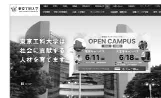
本学Webサイトトップページから「インターネット出願サイト」にアクセス

◎「マイページ」は、入学検定料支払い後自動的に作成される、あなたの「出願専用ページ」です。