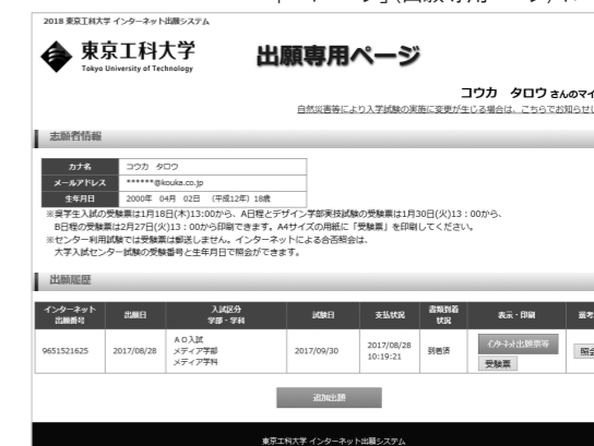
「マイページ」(出願専用ページ)イメージ

入学検定料支払い後、「インターネット出願サイト」の「マイページボタン」をクリックし「氏名(カナ)」「メールアドレス」「生年月日」を入力すると、「マイページ」にアクセスすることができます。