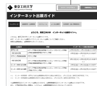
東京工科大学「インターネット出願サイト」。このページから出願登録ができます。